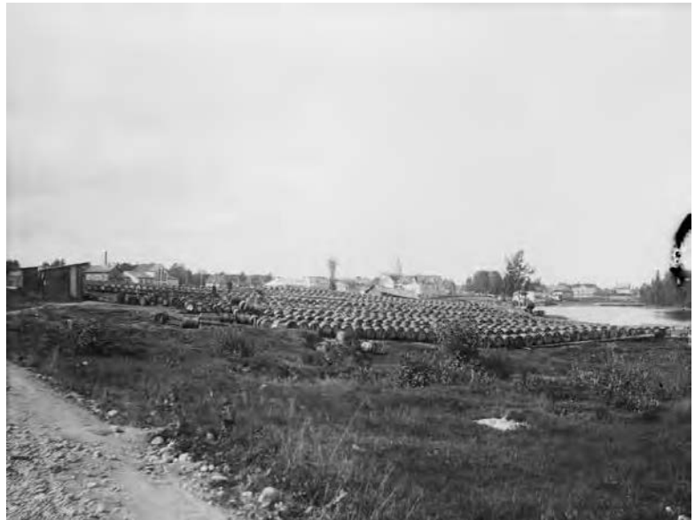
Tervatynnyreitä Kajaanissa 1913.