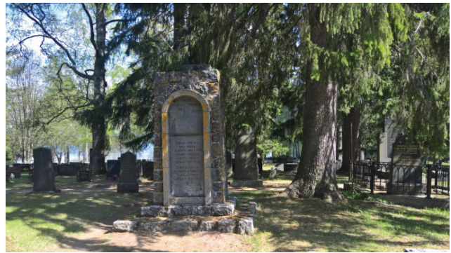
Muistomerkki tuhopoltetun Laukaan kolmannen kirkon paikalle on pystytetty Laukaan hautausmaalle 1939.