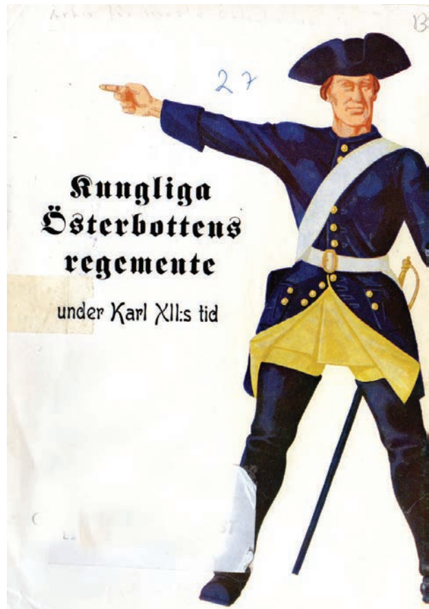
Karoliini tyypillisessä puvussaan. Petanderin teoksen kansi.

Tervolan Leinosilla oli kyllä sotilasperinnettä-