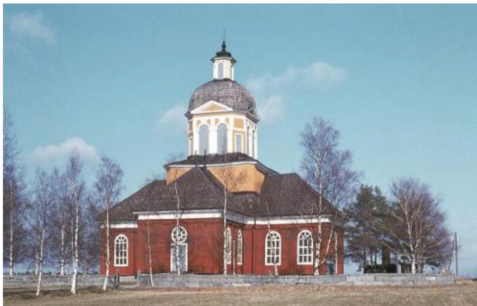
Luodon kirkko