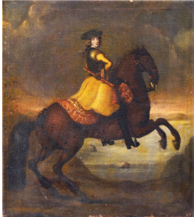
Kaarle XII David von Krafftin muotokuvassa vuodelta 1706.