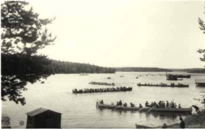
Kirkkoveneitä sata vuotta sitten jostakin päin Suomea. Kuva netistä löytyvästä oppimateriaalipaketista. ( http://www03.edu.fi/oppimateriaalit/vesi/kulttuuri_teksti_kirkko.htm )

eivät huolineet pojat, jotka rippikoulusta kotiinsa Vuolijoelle aikoivat, ihmisten eivätkä järven varoituksista.”