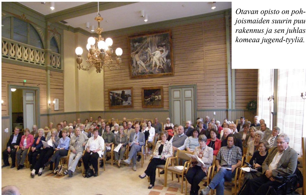
Otavan opisto on pohjoismaiden suurin puurakennus ja sen juhlasali komeaa jugend-tyyliä.

Sukulehteen toivottiin ilmoituksia, yhteys lehden päätoimittajaan. Päätoimittaja toivoi, että lehdissä julkaistua Leinosista kertovia juttuja lähetetään hänelle.