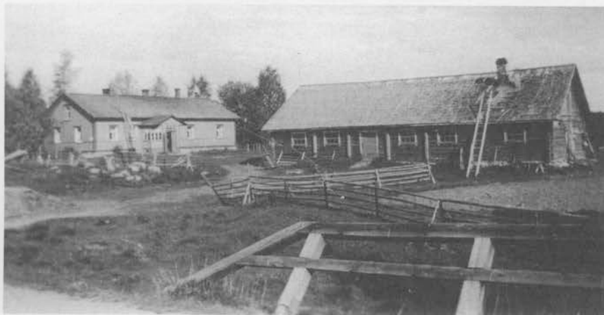
Hongan talo kuvattuna Hongan sillalta 1940-luvun alussa. Hongan kruununntila n:o 17 Temmeksellä on perustettu isojaon aikaan 1700-luvun lopulla ja se sijaitsee Meijerinmäen kohdalla Temmesjoen vastarannalla.

Lähde: Lauri Honka, Lapsuuteni joulusaarna, 1986.