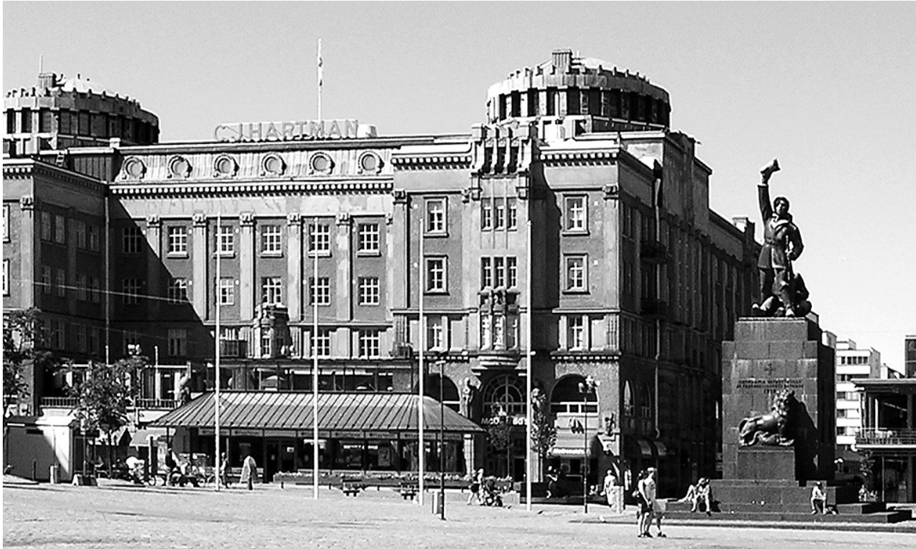
Suomen vapaudenpatsas Vaasan torilla.