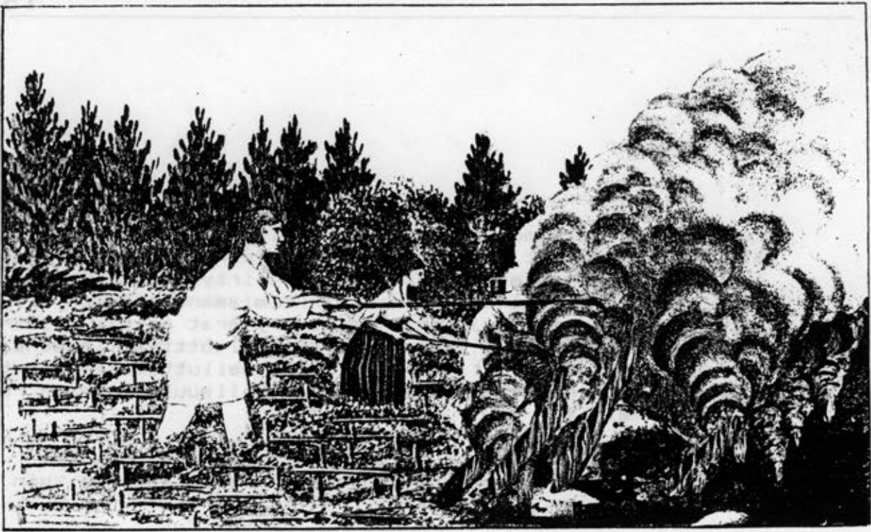
Wilhelm von Wright: Palon wjerdäjät. Akvarelli v. 1825

metsittymään, koska siinä ei kannattanut viljellä sillä kertaa kuin yksi kierto. Viljelijällä pitikin olla aina raivioita monessa työvaiheessa: pykälökköjä, poltettavia ja kylvettyjä huuhtia. Huuhdassa viljeltiin erikoisesti siihen soveltuvaa ns korpiruista. Se oli pienijyväästä, mutta erittäin pensovaa, minkä vuoksi kylvö suoritettiin hyvin harvaan " korkeintaan viisi jyvää virsun alle " Jos sää suosi saatettiin halmeesta saada viisikymmenkertainen sato, mikä oli paljon enemmän kuin konsanaan peltorukiista saatu.