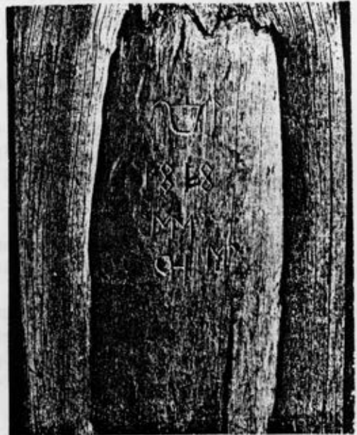
Kaskenvaltausmerkki Suomussalmelta vuo- delta 1818. Näihin aikoihin etenkin hyvistä kaskimaista alkoi olla jo niin suuri puute, että oli entistä tärkeämpää merkitä kullekin kuuluva ala.

Vaikka kasket olivat yleensä pieniä, oli niissä työtä yllin kyllin. Kun yhdessä talossa ei aina ollut tarpeeksi väkeä hankalimpien työvaiheiden suorittamiseen, oltiin väkilainaa- silla tai raivatiin yhteiskaskia. Varsinkin huuhdat olivat usein tällaisia. Maaton ja köyhä väki osallistui työllään kaskeamiseen ja näin syntyi ns kirvesmiesten ryhmä. He osallis- tuivat kaskan tekoon alusta lop- puun asti ja saivat työstään o- suuden kaskan tuotosta. Aina ei- vät halukkaat kaskankaatajat päässeet kuitenkaan kaskiyhti- öihin tai muistaneet pyytää kas- keamislupaa maan omistajalta, kun rajoistakaan ei aina oltu läheskään yksimielisiä, saatoi kaski joskus tulla kaadetuksi vahingossa naapurin puolelle. Tämä johti usein tappeluihin ja pitkällisiin käräjäinteihiin. Kaukana olevalta kaskimaalta saatettiin sato joskus varas- taakin. Ylipäätään kaskeaminen oli erittäin maata ja metsää tuhlaava tapa hankkia elantoa ja väestön lisääntymisen myötä tuli kaskimaista yhä suurempi puute. Niinpä Kainuussa vali- tettiin yleisesti kaskimaan puutteesta jo 1700 luvun jäl- kipuoliskolla, mutta vasta seu- raavalla vuosisadalla tuli karu todellisuus vastaan ei ollut " yhtään saareketta, jossa ei olisi halmetta käyty " Kaskeaminen kiellettiin Kainuussa 1851, mutta nälkä ja ahdistus sai aikaan sen, että kaskiviljelys kukoisti tuon ajankohdan jälkeenkin monilla kulmakunnilla ja kaskitalouden tilalle Kainuussa astui tervatalous eikä peltoviljelys kuten viranomaiset olisivat halunneet.