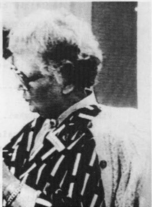
Kertojan persoonallisuus ansaitsee tulla ikuistetuksi videolla.

Tällaiset nimitys- ja muut videotouhut eivät kuitenkaan saa tuntua stressaavilta. Videota käytettäessä voidaan lähestulkoon rajattomasti ottaa yritelmiä uusiksi ilman että nauhaa kuluu hukkaan. "En minä osaa" on turha vastaväite, jos työ vain valmistellaan oikein. Videokuvaustilanne pitäisi järjestää viihtyisäksi. Läheisten sukulaisten tuttu koti on varmasti parempi kuin steriili studiomainen ympäristö. Valittaisiinko kuvausympäristöksi lapsuuden kotipaikka Kainuusta, Karjaalta tai Karjalasta.