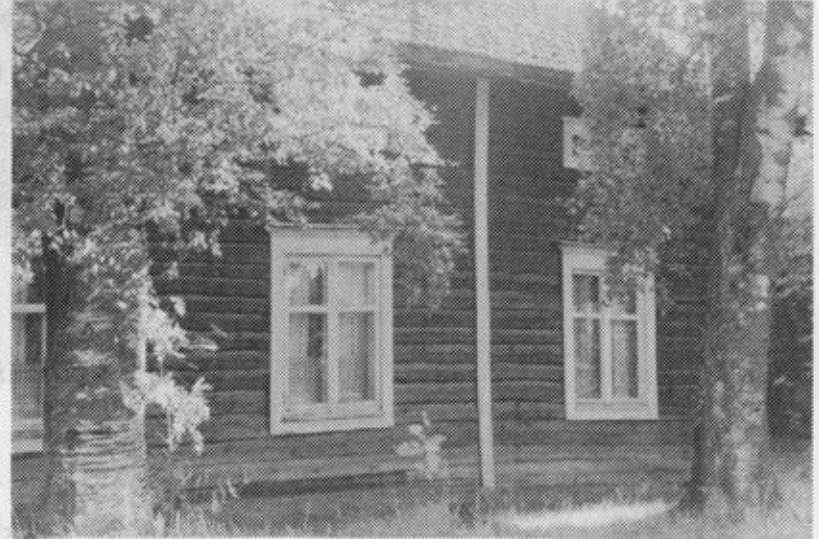
nykyisiä pihanäkymiä Artturi Leinosen syntymä- lapsuudenkodin tuntumassa