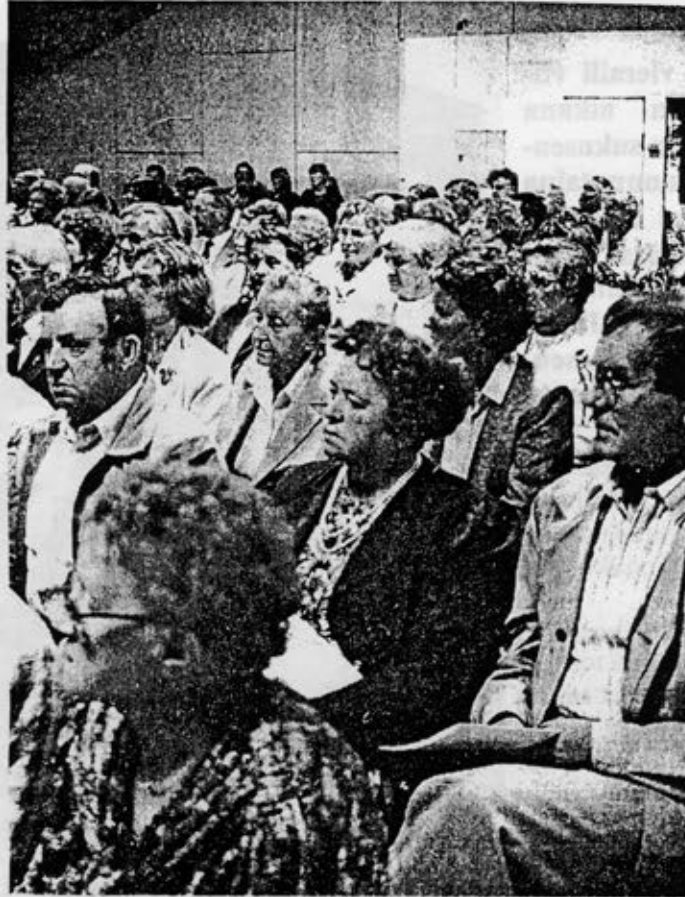
Kesäjuhla kokosi runsaasti väkeä Ylihärmään.

Kesäjuhlan ohjelmaa näytelmän lisäksi olivat Ylihär-