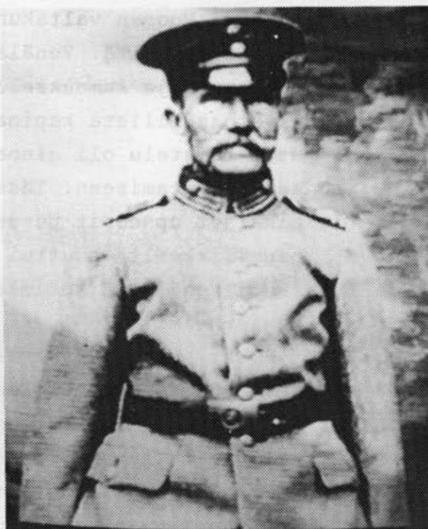
Sukuvalokuva-albumin aarteet lisäävät sukuvideon nautittavuutta.

(Seuraavassa lehdessä käsittelemme artikkeliin kuuluvat osat; tukimateriaali eli insertit ja koostamisen eli editoinnin)