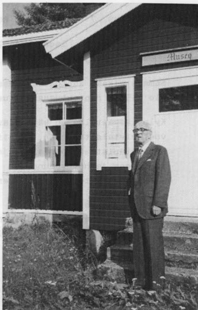
Kuvassa kirjoittajan isä v.1985 entisen kansakoulunsa, nykyisin museona, portailla.

Onpa seuraavastakin polvesta jo valmistunut opettajia.