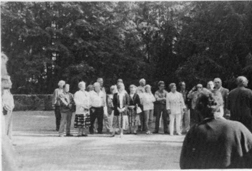
osa retken osanottajista Napuen taistelun muistomerkillä