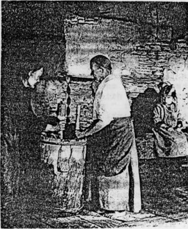
Pettujauhon tekoa kainuulaisessa pirtissä.

sen alta paljastuneen petäjäliinan ja kiskoivat irti niin korkealta kuin yltivät. Liinat sidottiin vitsalenkin mutkaan taakaksi ja kuljetettiin kotikonnuille säilöön. Kuoritut puut eivät kuolleet, sillä niihin jätettiin tyveen korttelin verran kaarnaa ja rungon pohjoispuolelle kolmen sormen levyinen jänne. Puu jäi " elätiksi ja muuttui vähitelleen tervakseksi. Kerätyt pettulevyt täytyi vielä silpiä ts erottaa niistä pois ruskea ja vihreä kuorikerros. Silpiminen tehtiin kotona ja oli se lasten ja naisten työtä. Sitä varten tarvittiin pyöreä keppi, jonka ympärille kuori kierrettiin. Puukolla vuoltiin kuorikerros irti ja pantiin auringonpaisteeseen kuivahtamaan ennen paahtamista. Liinan paahtaminen oli petun teossa tärkeä vaihe, koska sen tarkoituksena oli pihkan poistaminen. Liinat paahtettiin kuumassa leivinuunissa koko ajan kepakolla käännellän. Pihka kohosi pintaan ja voitiin raaputtaa puukolla pois. Liinat kuivuivat punaruskeiksi hauraiksi tolleriksi.