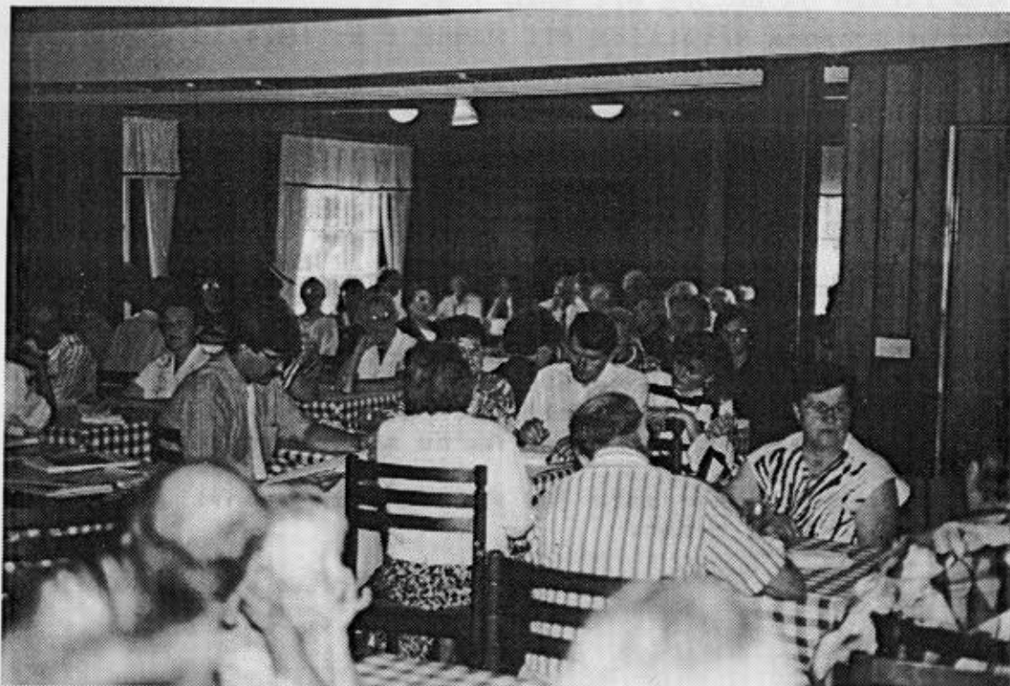
Kokouksen osanottajia Sport hotellissa.

Vielä kerran kiitos Kuopion kokouksen järjestäjille.