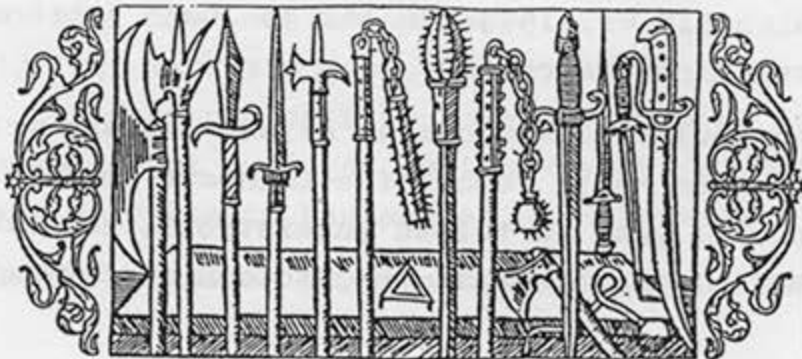
Kuva- aihe:Olaus Magnuksen Pohjoisten kansojen historiasta.

Ja ettei naisia unohdetaisi, lähelle noita 1800 - luvun vuosia ajoittuu myös se naimiskauppa Kangasniemelle, jonka tuloksena eräästä Laukaan Leinosten tyttärestä tuli presidentti Urho Kaleva Kekkonen äidin äiti!