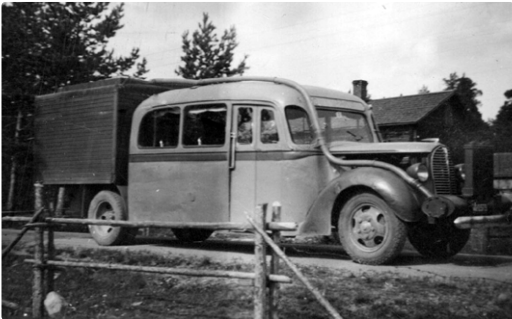
Hiipijä alkuperäisessä kuosissa 1940-luvun lopulla. Auto liikennöi Temmeksen ja Oulun väliä. Käyttövoimana oli bensiinin lisäksi häkäpönttö.