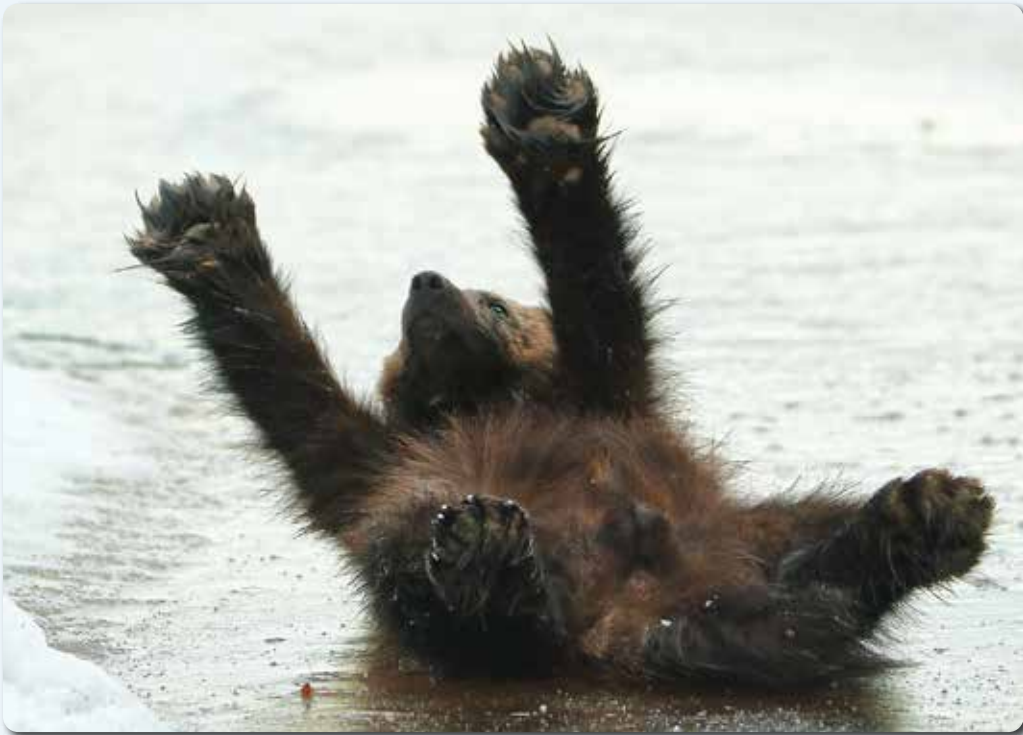
Hemmo-ahma voimistelee selällään jäällä tassujaan ojennellen. 2019

Yksi ahmoista päätyi paljon myöhemmin mökkisi pihaan ja kohtasitte uudelleen. Se oli parikymmentä kilometriä linnuntietä sinne missä olin niitä kuvannut aikoinaan. Minä olin lopettanut siellä kuvaamisen, kun naaras hävisi, varmasti kuoli. Samoihin aikoihin hävisi puoliso, vanha uros. Kuvaus ei tuntunut tarpeelliselta.