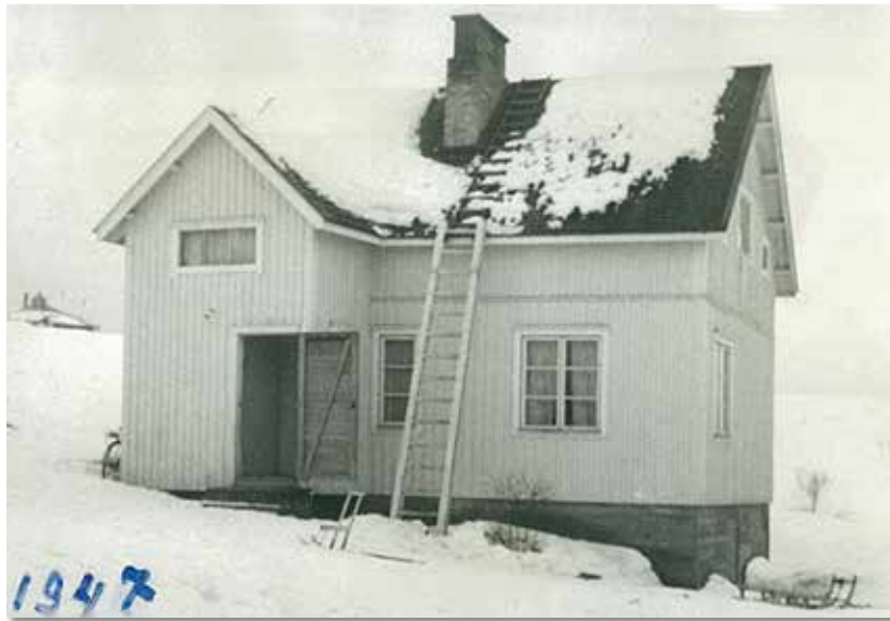
LIISA KUIVALAINEN PERHEALBUMI