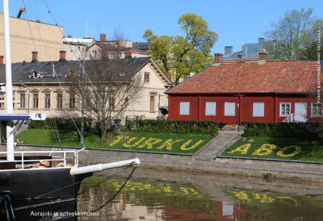
Aurajoki ja apteekkimuseo