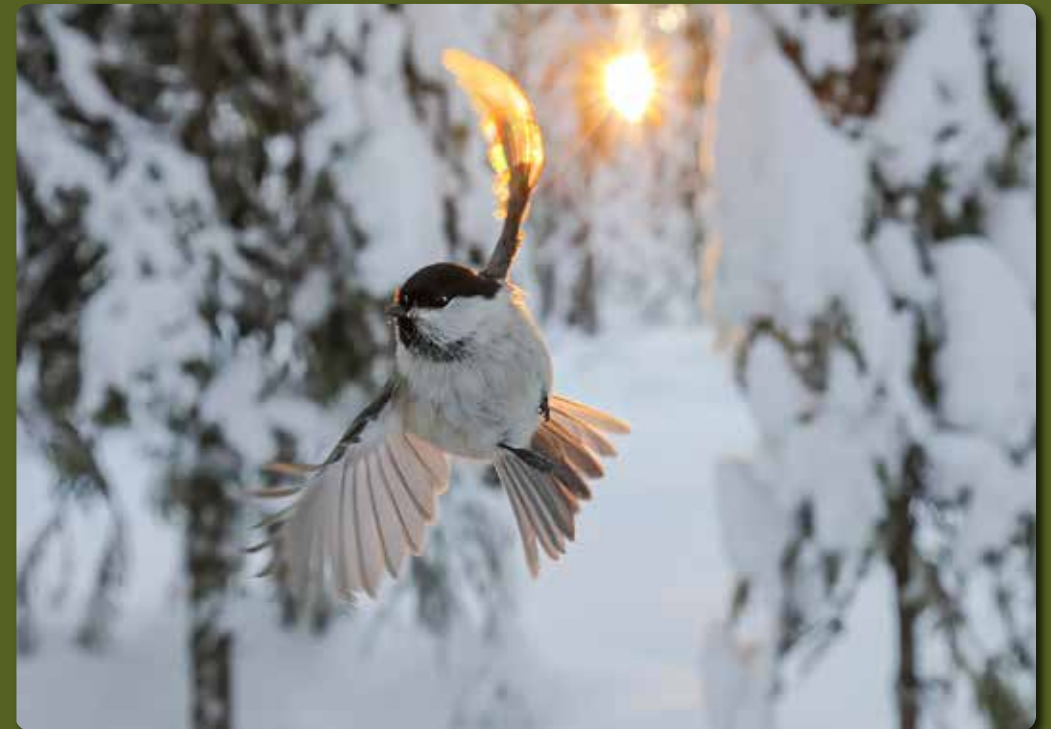
Hömötiainen talvimetsässä. 2022

SKR:n sekä Valtion valokuvataidetoimikunnan työskentelyapurahoja 1990–2014 Valtion ylimääräinen taiteilijaeläke 1.1.2014