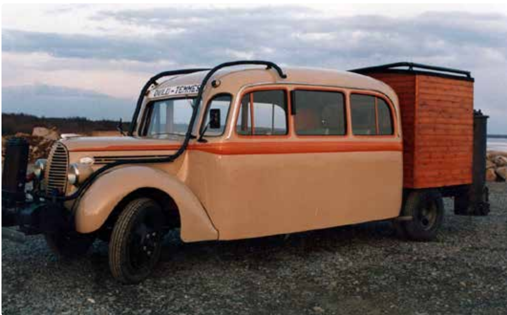
Hiipijä (vuosimallia 1938, Ford seka-auto) entisöitynä vuonna 1989.