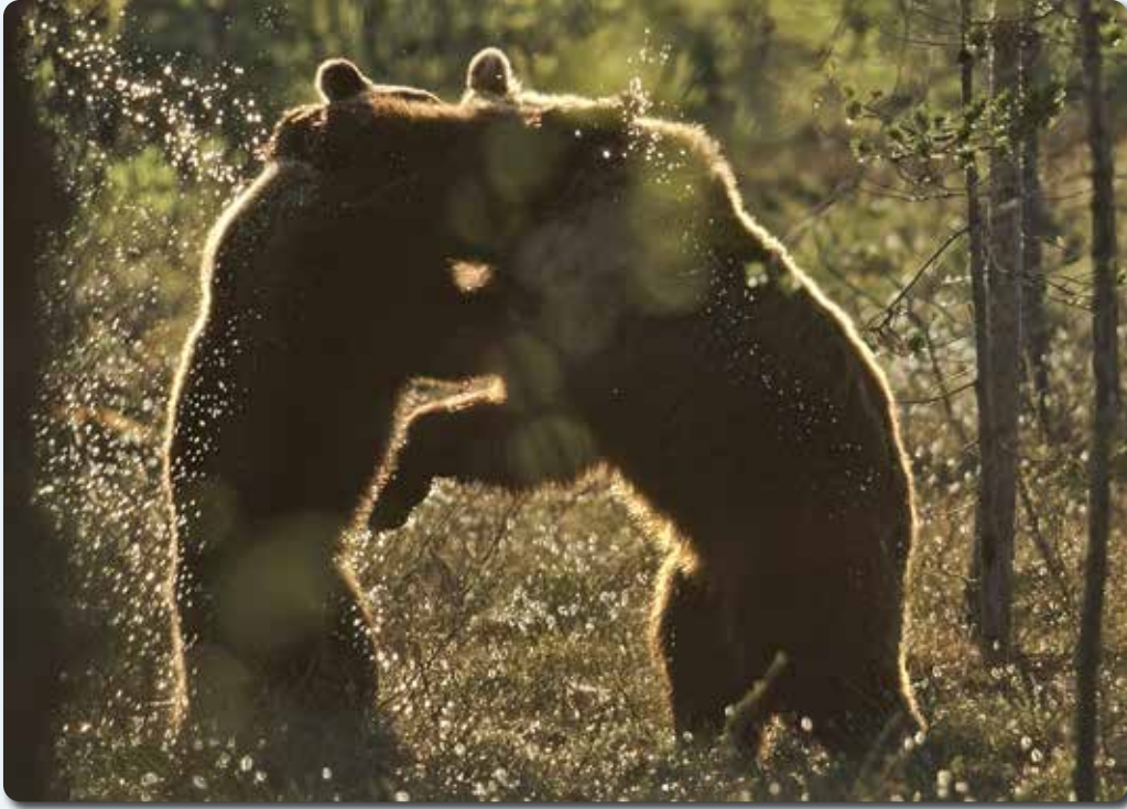
Ystävällismielinen painiottelu kaverusten kesken kuuluu tavatessa asiaan. 1997