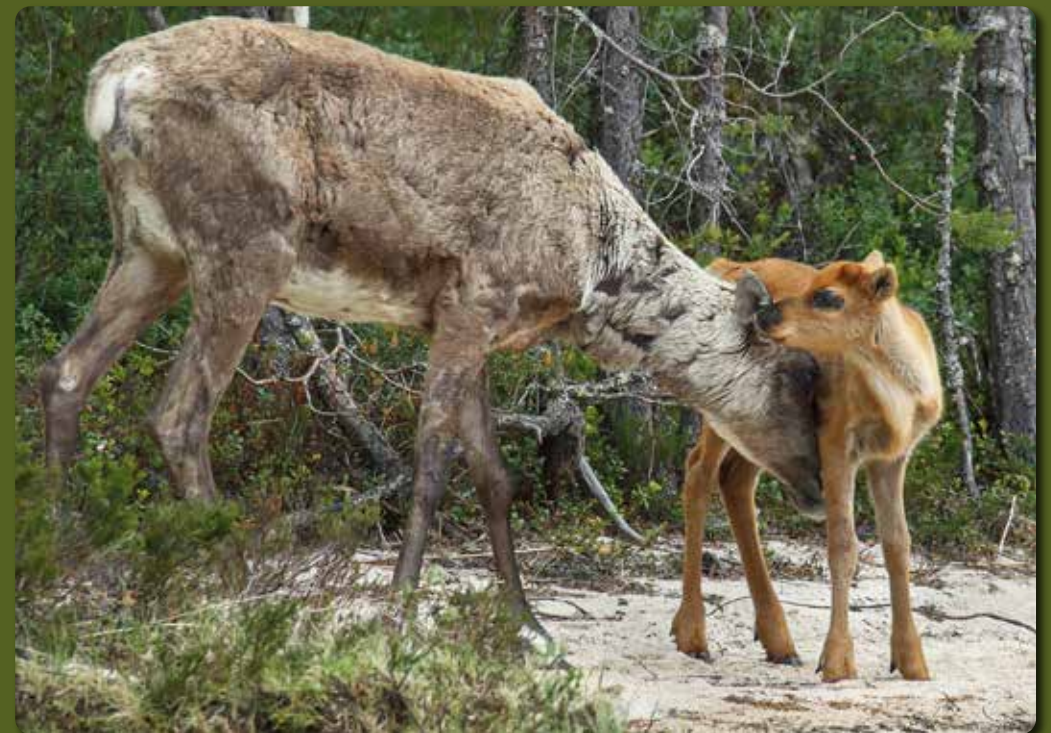
Metsäpeuraemä hempeilee vasalleen. 2015