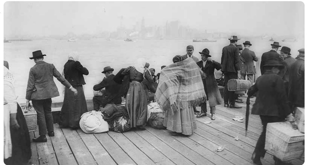
New Yorkin lauttaa odottavia siirtolaisia, Ellis Island, 30. lokakuuta 1912. Valokuvassa miehiä ja naisia nyyttien ja matkalaukkujen kanssa seisomassa maahannouspaikan laiturilla Hudson-joella.